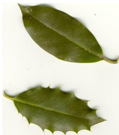
Hojas de HOL

Al contemplar ejemplares adultos de una cierta longevidad, podemos apreciar rasgos interesantes: HOL es un árbol de estructura piramidal (que ya denota su gran energía), en el que sus ramas inferiores se suelen extender hacia el suelo, arrastrándose y creando un perímetro alrededor del árbol en el que no puede crecer ninguna otra planta. También nos daremos cuenta que las hojas inferiores tienen espinas en su margen (alternamente dirigidas hacia arriba y hacia abajo) como protección contra los herbívoros (abajo en la fotografía) y que en las superiores (arriba en la fotografía) a menudo desaparecen. Es un árbol de hoja perenne, que resiste muy bien el frío, que tiene flores tetrámeras (4 pétalos) y que estas, masculinas y femeninas están en árboles distintos (especie dioica). En los acebos femeninos, después de la polinización se forman las conocidas bayas rojas, que son tóxicas para nosotros (producen vómitos y diarrea).