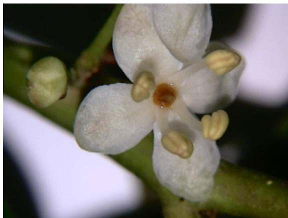
Flor masculina de Holly, con sus estambres erectos

Las flores de cuatro pétalos son de color blanco y suave aroma y a menudo tienden sus pétalos hacia atrás. Los estambres, en nombre de cuatro también salen erectos y son bastante largos en relación al diámetro floral.